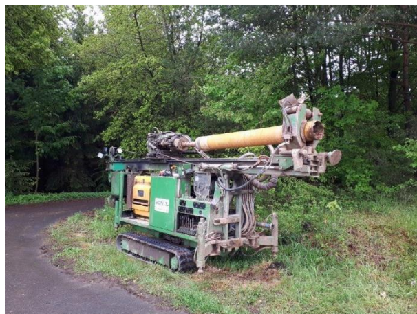
Kernbohrgerät auf Kettenfahrwerk