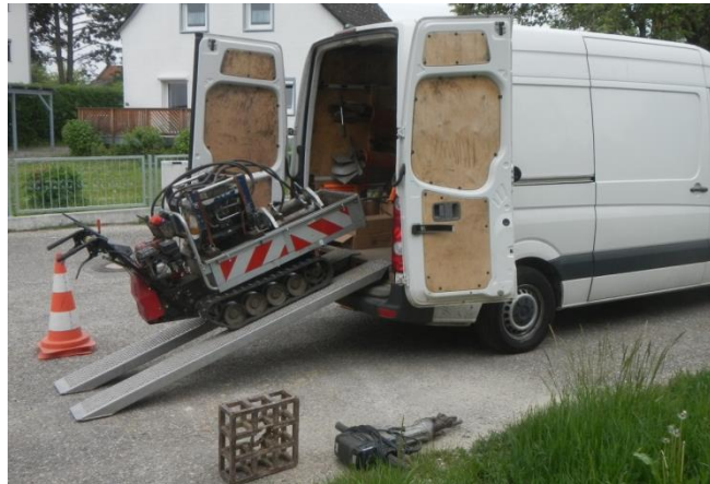
Transportraupe mit Hydraulikaggregat für hydraulisches Ziehgerät, Stromaggregat, Elektrohammer, Lindenmeyer Rammsondiergerät