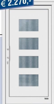
Kunststoff-Haustür "Laguna2", weiß

Informieren Sie sich im großen Fenster- und Türenstudio - Herzlich willkommen in Zell!