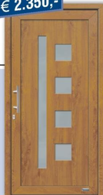
Kunststoff-Haustür "Balar2", foliert