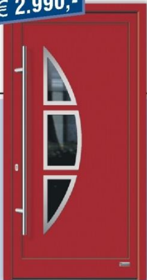
Aluminium-Haustür "Juno6E", RAL