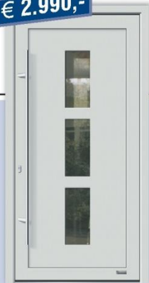
Aluminium-Haustür "Heldan2", RAL